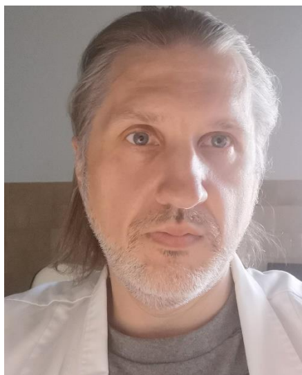
MD Darius Dicevicius Ultraääniohjattujen toimenpiteiden erityisosaja